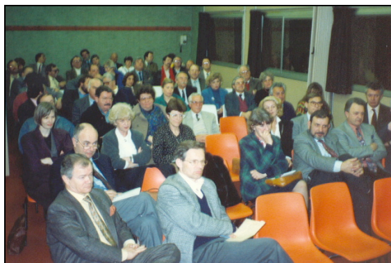
Assemblée Générale à Palavas les Flots

18 février 1993 : Assemblée Générale d'ICEO, après 3 ans d'existence, c'est l'heure du premier bilan.