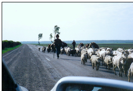
Craiova, en attendant la neige

Du 8 au 19 novembre 1993 : à Craiova en Roumanie, stage de formation à l'économie de marché. Etude des bases économiques : Application à l'agriculture et à l'élevage. Etude des filières.