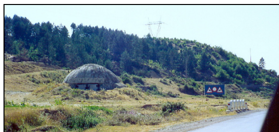
La frontière albanaise et ses fortifications

Du 22 juillet au 18 août 1993 : mission en Albanie, Macédoine, Bulgarie, Roumanie, Turquie et Croatie. Etude de la situation géo-politique et des conséquences de la chute du système soviétique.