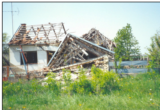
En passant en Croatie, le 10 mai

Du 30 avril au 10 mai 1993 : mission des responsables de la Commission agricole d'ICEO en Roumanie. Etude de la poursuite des programmes de coopération. Visite du comité spécial du Front de Salut national.