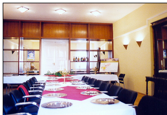
La salle principale de l'antenne d'ICEO