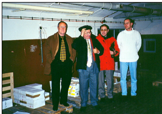
Inspection du site de stockage des vins dans l'ancien bunker anti atomique du Parti Communiste à Cracovie

Du 11 au 18 mai 1999 : mission exploratoire en Roumanie à Bucarest