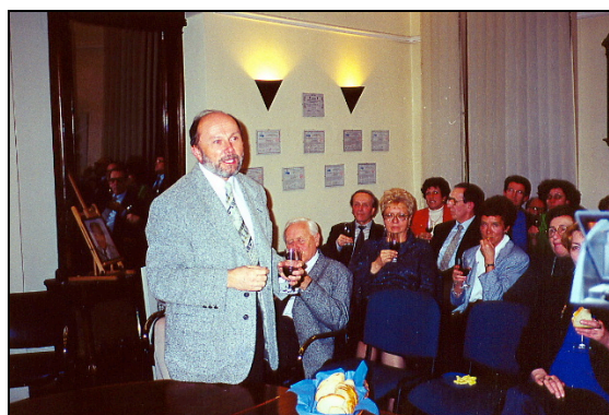
Séance solennelle de l'Académie du Vin

Du 11 au 18 mai 1999 : mission exploratoire en Roumanie à Bucarest