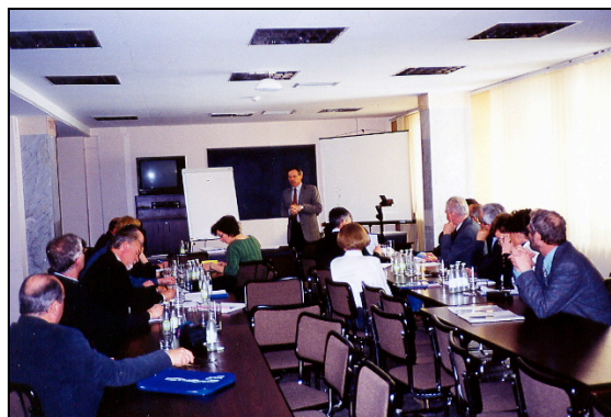
Séance de travail franco-germano-polono écossaise Tempus à Krynica

Du 13 au 18 mars 1999 : journées TEMPUS à Krynica et séminaire à l'Académie du vin de Cracovie.