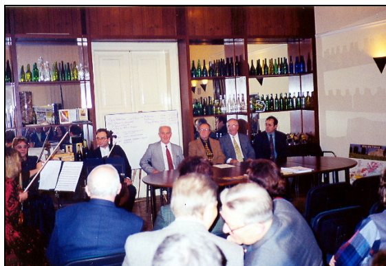
Les responsables des caves coopératives devant l'Académie du Vin de Cracovie.

Du 19 au 24 janvier 1999 : mission exploratoire organisée pour les Collines de la MOURE qui veulent prospecter le marché polonais.