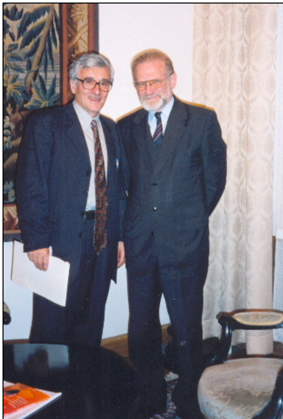
Avec le Professeur GEREMEK

Rencontres à Varsovie avec le Professeur GEREMEK, devenu Ministre des affaires étrangères. Remise en main propre d'un exemplaire dédié du guide pratique du vin.