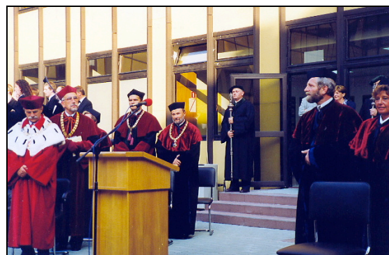
Inauguration de la nouvelle Faculté de Pharmacie de Cracovie.

Du 8 au 13 septembre 1999 : participation de responsables d'ICEO aux manifestations organisées à Cracovie pour le 600 e anniversaire de l'Université JAGELONNE. Séminaire œnologique à l'Académie du vin de Cracovie.