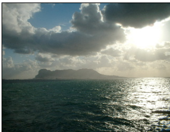
En passant près de Gibraltar

Du 9 au 19 décembre : nouvelle mission au Maroc pour relancer les anciens étudiants marocains qui ont fait leurs études à Montpellier et qui sont aujourd'hui professeurs voire doyens de leurs Universités.