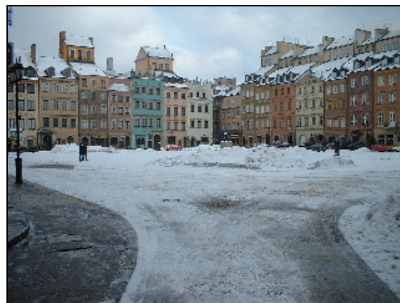
Varsovie sous la neige

12 au 19 mars : mission de préparation en Pologne des premières journées œnologiques de Zakopane.