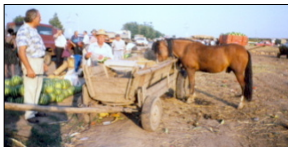
Marché au bord de la route

Le 26 septembre : Lyon (participation) et le 9 décembre : Montpellier (organisation). Réunions préparatoires, dans le cadre du groupe "Roumanie" de l'APCA, à des missions d'investigation pour une coopération institutionnelle entre Chambres d'Agricultures françaises et Ministère de l'Agriculture roumain.