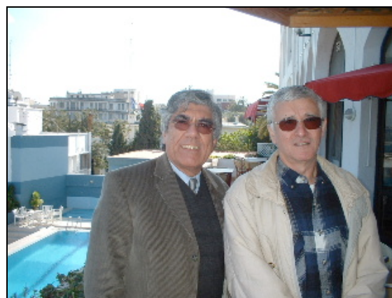
Le Consul Général ; un vieil ami