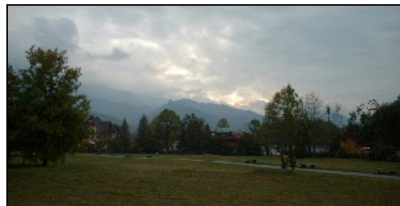
Un paysage de rêve

décor magnifique que s'est déroulée la manifestation. Les cours et les séances de dégustation ont eu lieu dans des conditions optima, grâce à la sollicitude de la directrice de l'auberge « Pod Berlami » et de son mari.