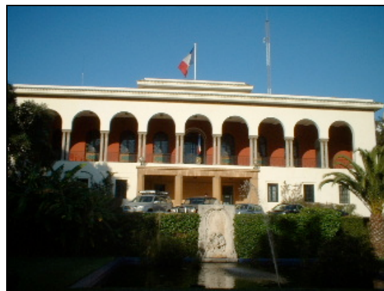
Le Consulat Général de Tanger : lieu de rêve

Arrivée à Tanger où le nouveau Consul Général de France est un ami. Ainsi du coté français toutes les conditions sont réunies pour pouvoir développer nos projets.