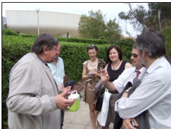
Des questions encore et encore