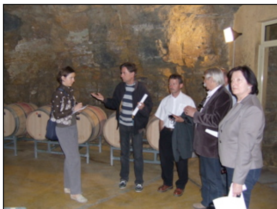
Visite du chai du Centre

Visite de la Cité de la Vigne et du Vin : Un bel outil scientifique et culturel.