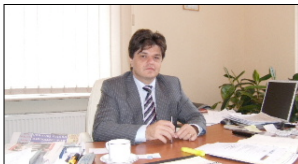
Rencontre avec l'adjoint au maire

28 septembre : Retour à Montpellier après une mission de 6000 kilomètres qui a permis de rencontrer une vingtaine d'interlocuteurs au cours d'une douzaine de rencontres.