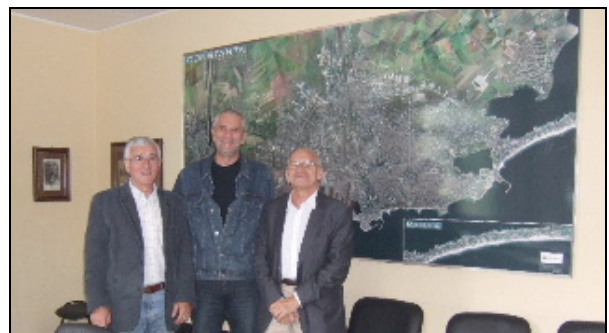
Devant une photo satellite de Constanta