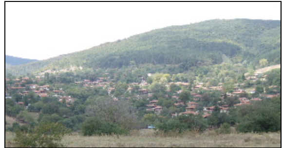
Dans la montagne, un village de tisserands