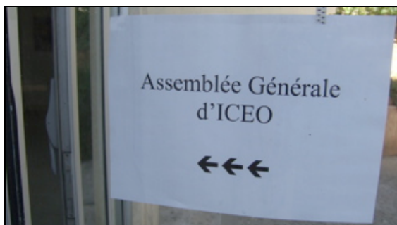
Clôture de l'exercice comptable 2007, rapports statutaires et élection des dirigeants.