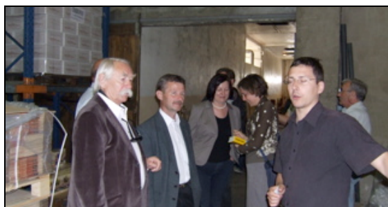
La cave coopérative présentée par son directeur

Visite de la cave coopérative de Gruissan et d'une cave particulière.