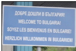
Accueil de bienvenue en quatre langues