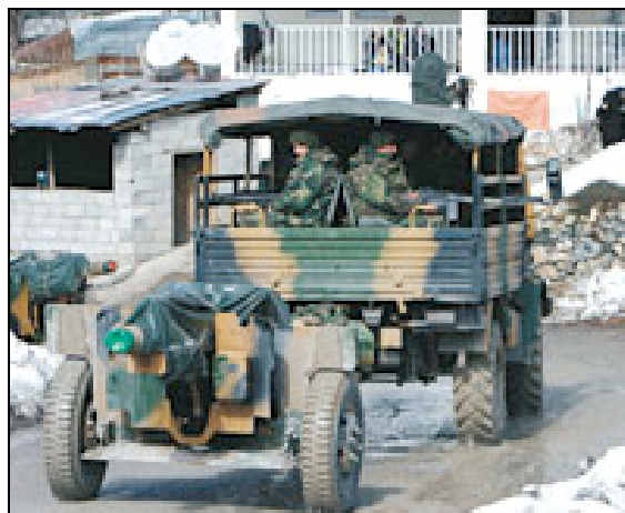
L'armée turque entrant en Irak