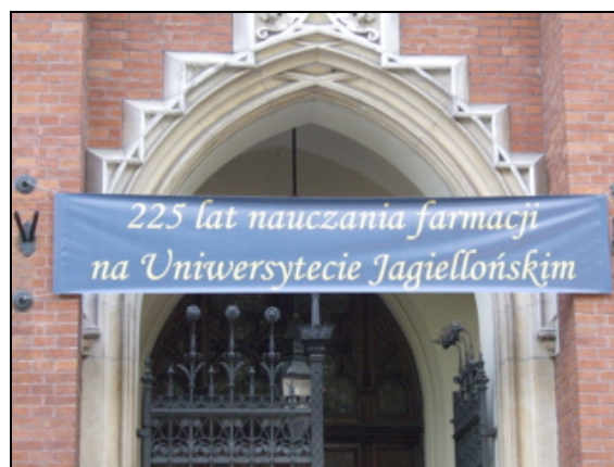
225 ème anniversaire de la Faculté de Pharmacie

Participation aux cérémonies liées à la célébration solennelle du 225 ème anniversaire de la Faculté de Pharmacie de Cracovie dans Aula Collegium Novum ul Golebia 24.