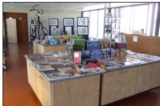
A la Cité de quoi lire et de quoi saliver

Visite de la Cité de la Vigne et du Vin : Un bel outil scientifique et culturel.