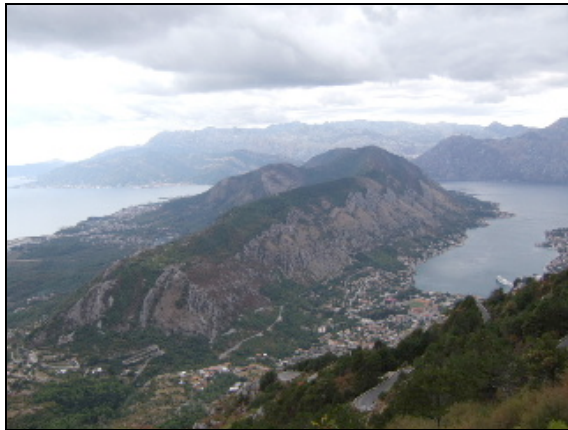
Monténégro : en quittant l'Adriatique, vue de la route vers Cetinje et Podgorica

directement, des perspectives nouvelles de coopération qui s'ouvrent à l'Association.