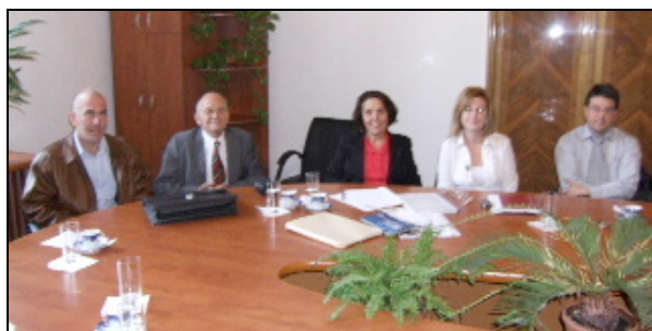
Réunion au Ministère de l'Agriculture