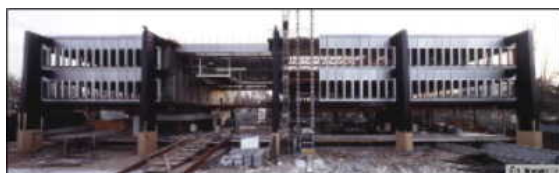
Warszawa : remont ambasady francuskiej