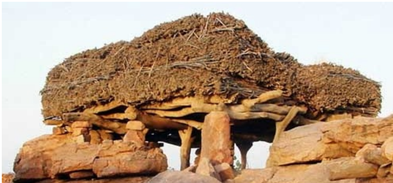
Une toguna en pays dogon, une maison à parole dans une société apaisée

Le Ministère de l'éducation nationale souhaite que l'enseignement s'ouvre aux cultures d'origines des populations récemment immigrées, notamment africaines. On pourrait donc avoir recours dans les établissements les plus agités à la vertu apaisante de la toguna 107 , ou « maison à parole » présente dans le centre de tous les villages dogons. Ce serait une façon pédagogique et élégante de faire reconnaître une partie de la richesse et de la sagesse africaines.