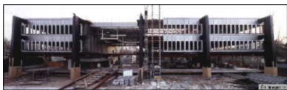
Varsovie : Ambassade France en rénovation