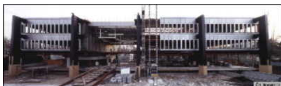
Warszawa : remont ambasady francuskiej