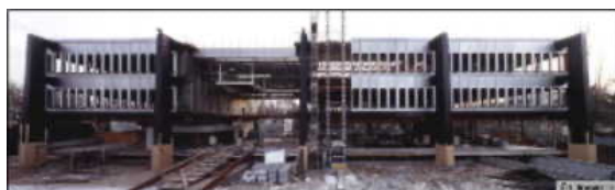
Warszawa : remont ambasady francuskiej