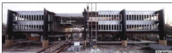
Varsovie : Ambassade France en rénovation